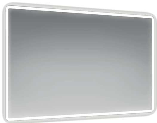
IMMAGINE PRODOTTO / PRODUCT IMAGE